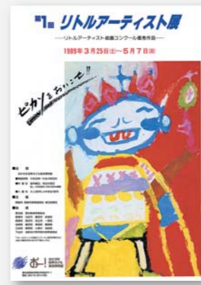
平成元年3~5月 第1回リトルアーティスト展