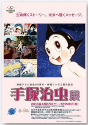
平成25年4~7月 手塚治虫展