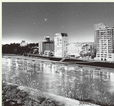
泰平の折りプロジェクト (平成27年12月26日開催予定)

景観・歴史・文化など河川が有する地域の魅力や地域の創意を活かし、まちと水辺が融合した空間形成の推進を図るものです。