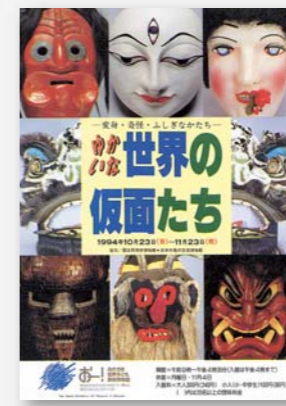
平成6年10~11月 一変身・奇怪・ ふしぎなかたちー ゆかいな世界の仮面たち