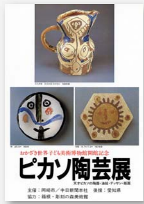
昭和60年5月 開館記念 ピカソ陶芸展