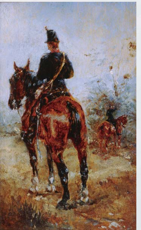
トゥールーズ・ロートレック 馬上の二人の兵士 16-17歳(1881年)

主な出品作家 ロートレック モネ ムンク ピカソ 青木繁 池田満寿夫 伊東深水 岸田劉生 高村光太郎 東郷青児 平山郁夫 村山槐多 山下清 横尾忠則