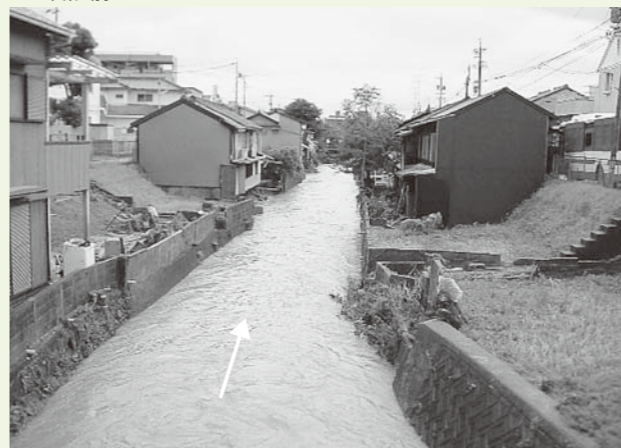
【伊賀川の状況：瀧見橋下流】

平成20年8月末豪雨による甚大な浸水被害を受け、21年度から重点的かつ緊急的に進めてきた伊賀川始め市内5河川の改修が完了します。