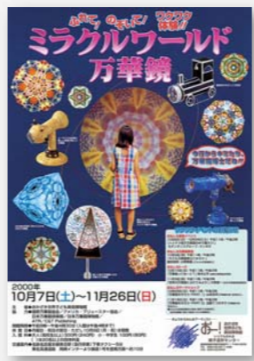
平成12年10~11月 ふれて!のぞいて! ワクワク体験! ミラクルワールド万華鏡