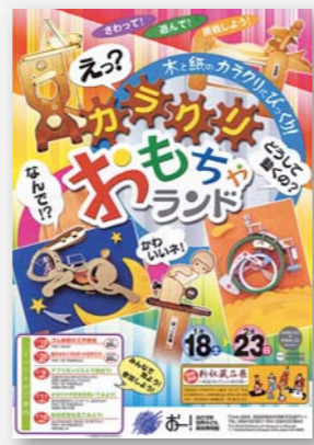
平成15年1~2月 さわって!遊んで! 挑戦しよう! カラクリおもちゃランド