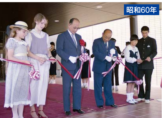
昭和60年 5月4日 オープン