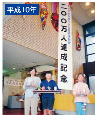
平成10年 11月 来館者数200万人達成 (平成25年8月には400万人を達成)