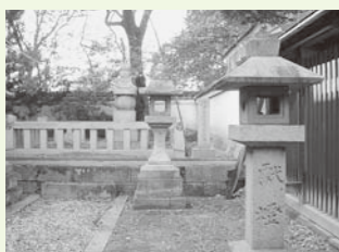
▲信康首塚(若宮八幡宮)