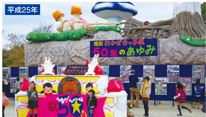
平成25年 今年で52回を迎える「造形おかざきっ子展」。第22回(昭和60年)から、子ども美術博物館を会場として開催しています。