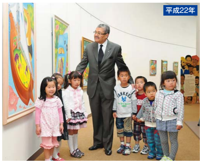
平成22年 4月 「ハイチの素朴な絵画展」 駐日ハイチ共和国代理大使来館

ギャラリートーク 6月21日(日)・7月5日(日) 14時 展示会の見所を学芸員が解説します。 ※当日有効の観覧チケットが必要です。