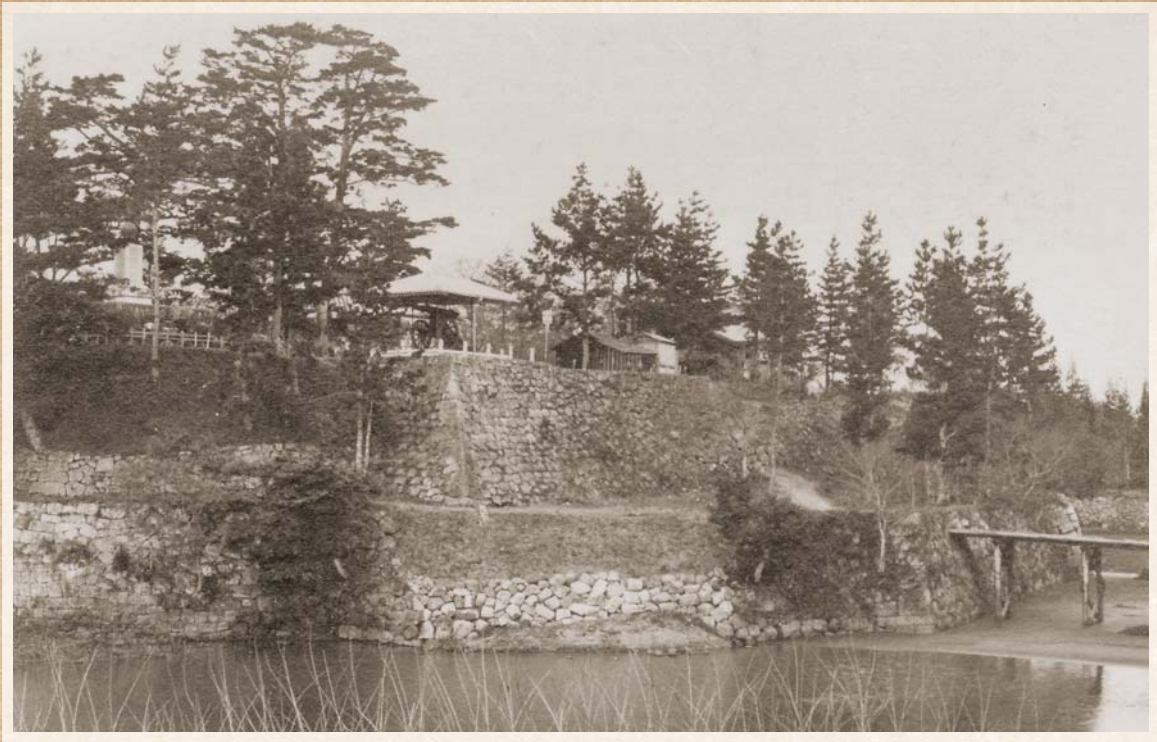
▲大正期の岡崎公園。現在の神橋付近に、欄干のない通直な木橋がかかっていた。