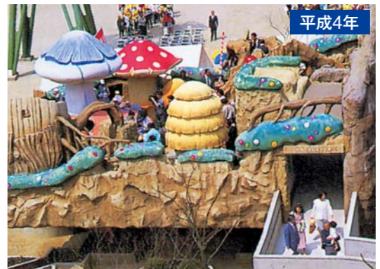
平成4年 4月 「妖精の棲む浮かぶ島」完成