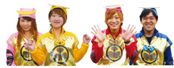
▲家康公四百年祭おかざきPR隊イエヤスマン