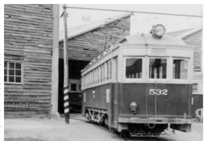
のこぎり屋根の車庫と大型電車 筆者撮影(昭和37年)

戸崎町の次に停まるのが「車庫前」です。文字どおり市電の車庫があり、日々、電車の点検作業が行われていました。廃止間際、市電の電車は、単車と呼ばれた小型電車が十六両、大型のボギー車が二両、貨物電車二両の総勢二十両ありました。朝のラッシュが終わると、仕事を終えた電車たちが休んでいる姿が見られました。