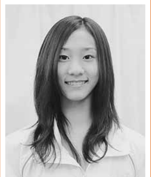
中京大学附属中京高校3年

コンクール当日は、やはり不安がありました。380人ほどの部門出場者の中で決選に進むのは36人。予選の時は緊張してしまつて駄目かと思いましたが、その後は雰囲気にも慣れ、ほぼ練習通りに踊ることができました。3位に入れたことはすごくうれしいですが、どんな状況でも自分の納得のいく演技ができるようになりたいと思っています。今は、夏の全日本バレエコンクールを目指して毎日練習に励んでいます。世界で活躍できるようにプロになることが夢。そのためのステップである今を精一杯頑張っています。