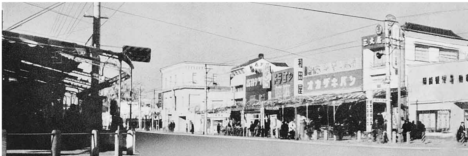
戦災都市の中でも一早く復興を遂げた中心市街地(現在の康生交差点北・昭和33年ごろ)