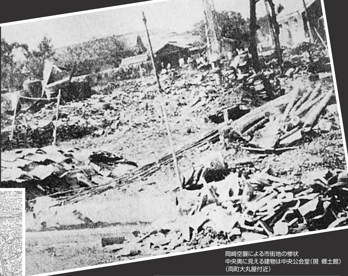
岡崎空襲による市街地の惨状 中央奥に見える建物は中央公会堂(現 郷土館) (両町大丸屋付近)