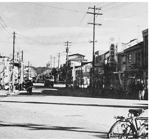
復興完成後の同上(昭和32年ごろ)