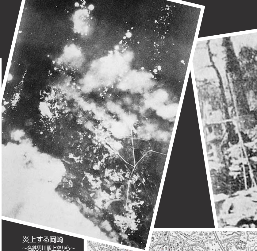
炎上する岡崎 ～名鉄男川駅上空から～