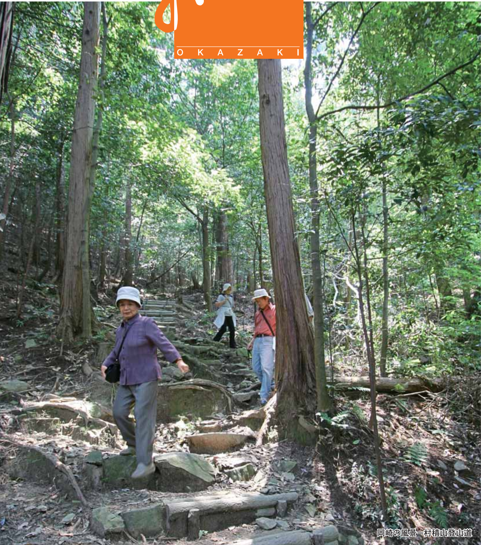
岡崎の風景—村積山登山道