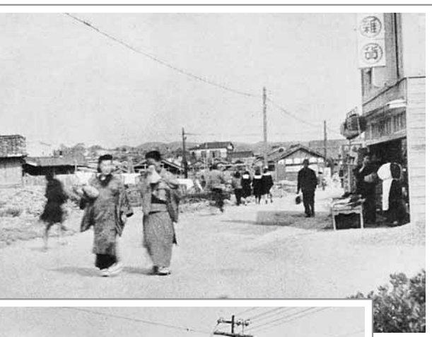
復興前の伝馬通り(昭和22年ごろ)