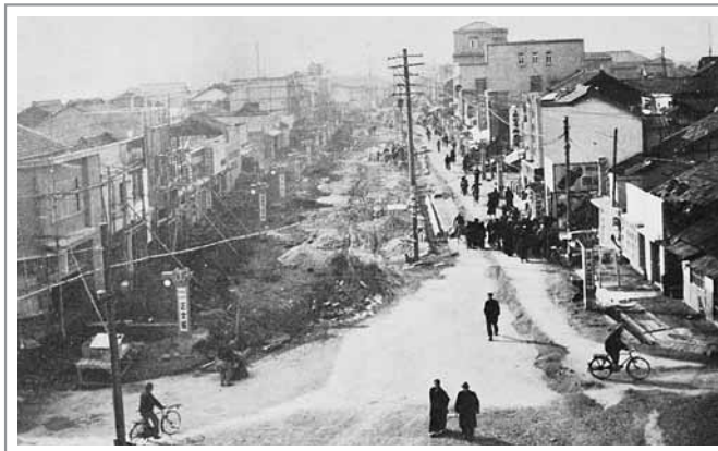
復興途中の康生東通り(昭和25年ごろ)