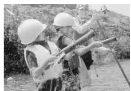
自然共生課森の駅推進班 公23・6921