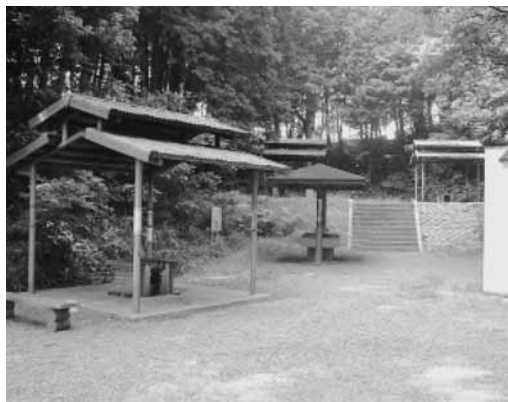
大谷公園バーベキュー場

準備・片付け・清掃は利用時間内 に行ってください／火気を伴う調理 は備え付けのバーベキュー炉で行っ てください／ごみは持ち帰ってくだ さい／施設内へ車両を乗り入れでき ません／次の利用者が気持ち良く利 用できるように心掛けましょう。