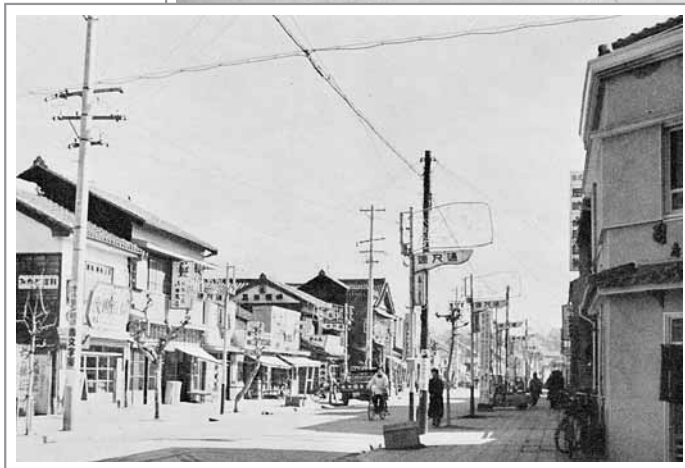
復興後の同上(昭和32年ごろ)

市庁舎を戦災から守った岡崎市は、市議会と一丸となり、被災地域の75%に当たる131%の戦災復興事業を進めました。思い切った街路計画や都市公園の造成などに全国に先駆けて取り組み、復興モデル都市として建設大臣から表彰されました。籠田公園も都市計画事業として造られました。昭和24年には仮換地指定がほとんど完了し、住宅建築も89%が復興するという迅速なものでした。上下水道やガス管の移設なども進められ、昭和33年に復興事業が完成。当時の功績は、現在の区画整理事業にも脈々と受け継がれています。