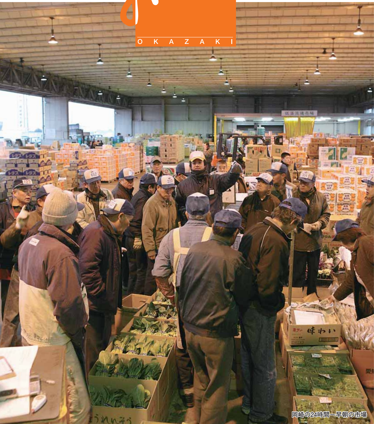
岡崎の24時間—早朝の市場