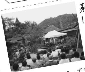
● 茅葺の里ジャズライブ