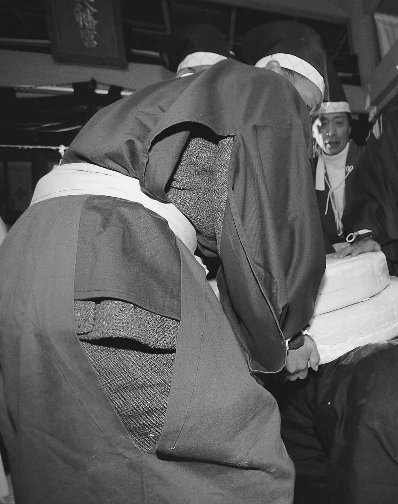
▲ 大鏡餅を背負わされ、なかなか前に進めない牛。愛知万博でも披露した名場面です。