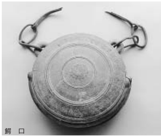
生涯学習課文化財班 公23・6177