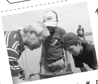
● 岡崎100セミ当日ボランティア