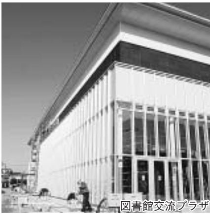
図書館交流プラザ