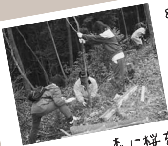
● おおだの森に桜を植えよう