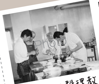
● おとこの料理教室