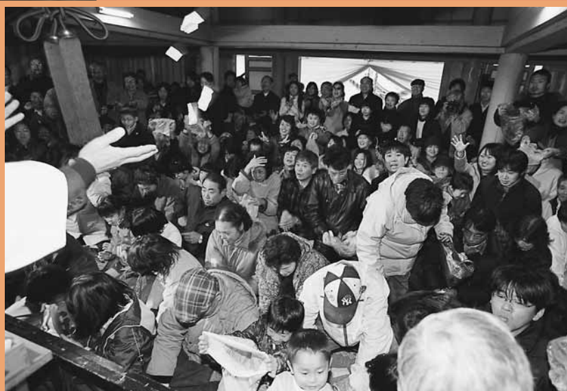
▼最後の餅投げに盛り上がる観客

お正月を迎えた1月3日、山中八幡宮（舞木町）で室町時代から伝わる祭り「デンデンガツサリ」が行われました。一年の豊作を祈るこの祭りは、市無形民俗文化財にも指定されている、古式ゆかしいお田植え祭りです。「デンデンガツサリヤ」とい出すことからこの名がついたと言われ、太鼓のリズムに合わせて「御田植ノ歌」を前歌、後歌に分けて合唱します。祭りの最高潮は、ワラのかぶりものをつけた牛役の男性が四つんばいになり、大鏡餅を背負いながら歩くこのシーン。牛が背負いきれないほどの大豊作を祈ります。祭りの最後に、切り分けた餅を観客に投げて、一年の無病息災を祈りました。