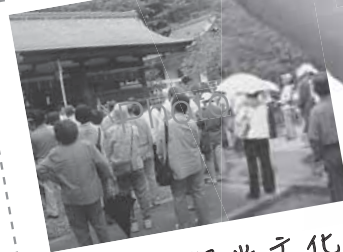
● 岡崎観光文化百選めぐり

「団塊の世代」— 全国的に人口が急増する現象が起きた、いわゆる第一次ベビーブームに生まれた世代で、急成長を遂げた戦後の日本を支えてきた世代です。東京オリンピックに心を躍らせ、大阪万博で高度経済成長を実感し、ビートルズに熱狂した青春時代。岡崎市においてもこの年代の人口は他の年代と比べて多く、昭和22(1947)年から3年間に生まれたかたの人口は1万8千人を超えています。今年は、この世代が60歳を迎え、人生の新たなステップを踏み出す最初の年でもあります。