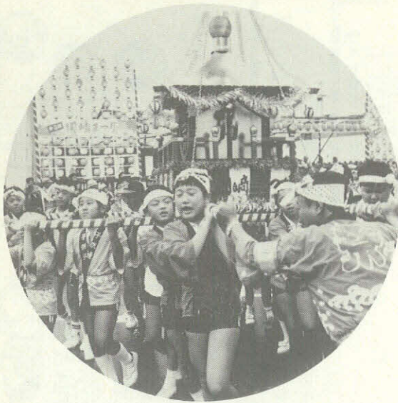
秋を彩る第3回「岡崎まつり」が 10月25・26日の二日間、わたって開 催。写真は元気よく伝馬通りを練り 歩く子供みこし列 (10月25日)