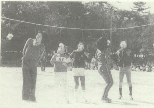
岡崎市母子福祉会運動会が、東公 園広場で親子元気に楽しく行われま した。(11月3日)