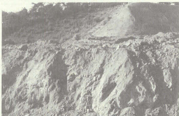
巴川断層によってもみくちやにされた花崗岩の露頭。ハンマーの位置が断層面の一つ、写真全体が破碎帯になっている（北斗台地）。その規模は幅が数メートルもある大破碎帯から単なる割れ目程度の小規模のものまで含まれている。そしてもちろんこのすべてが地震の巣といわれる活断層であるわけではない。むしろかなりの古傷が大勢を占める。また、他地域に比較して特に多いというわけでもない。しかし、一枚岩盤といわれた岡崎の基盤が実は傷だらけであったとは……。

みのエネルギーは放出される。この時の振動が地震であり、その割れた面が断層である。断層は、昔の地震による大地の古傷である。